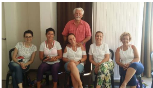
Une partie de la délégation turque

295 participants de 31 pays, avec d'importantes délégations belges et turques, mais aussi des représentants de Suède, Allemagne, Grande-Bretagne, Autriche, France, Espagne, Italie, Chine, Singapour, du Kenya, de Gabon, d'Australie, de Nouvelle Zélande.