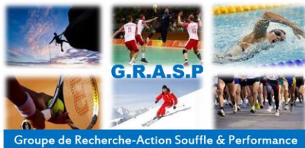
Groupe de Recherche-Action Souffle & Performance